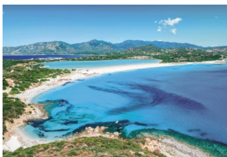
Pullman Timi Ama *****

Villasimius – ab 21.05.2022 DZ Classic - Gartenseite Halbpension ab CHF 1.600.–