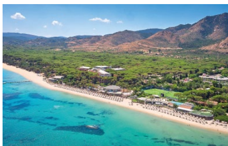
Forte Village Resort *****

Villasimius – ab 21.05.2022 DZ Landseite Frühstück ab CHF 1.410.–