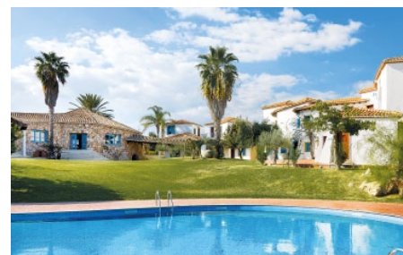
Corte Bianca **** (adults only)

Porto Cervo – ab 21.05.2022 DZ Bestpreis Landseite Frühstück ab CHF 1.217.–