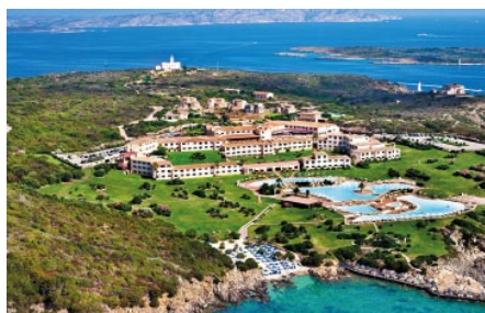
Colonna Resort Cala Granu *****

Santa Margherita di Pula – ab 14.05.2022 Deluxe Bungalow Halbpension ab CHF 2.434.–