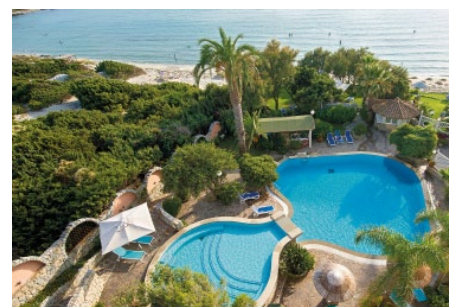
Stella Maris ****

Villasimius – ab 21.05.2022 DZ Classic - Gartenseite Frühstück ab CHF 1.294.–